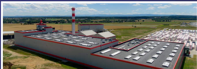
Восточная Европа 2020