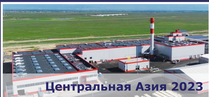
Центральная Азия 2023